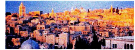
Au soleil levant, vue vers le St Sépulcre depuis Sion

Date limite d'inscription : 01 août 2017