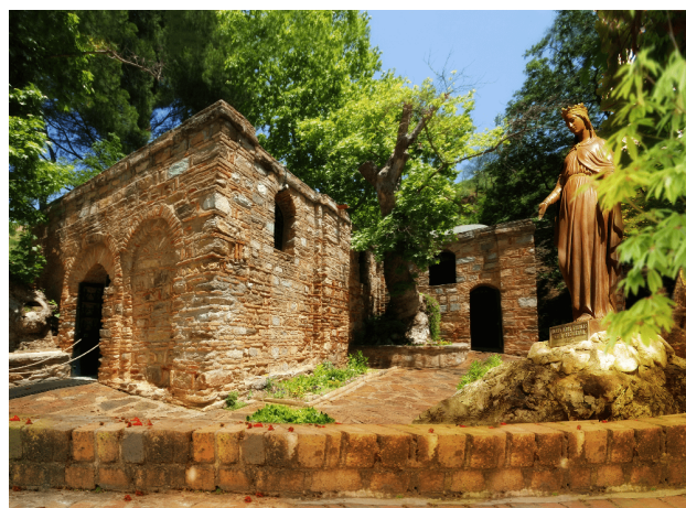
Meryem Ana Evi, maison de la Vierge Marie à Ephèse (Turquie)

Liban de Harissa ; Monastère Stella maris à Haïfa ; Basilique Notre-Dame Ta' Pinu de Gharb ; Sanctuaire Notre-Dame de Lampedusa ; Sanctuaire Notre-Dame-du-Rosaire à Pompéi ; Monastère de Santa Maria de Montserrat ; Notre-Dame de Zeitoun au Caire ; Monastère grec-orthodoxe de Kykkos à Chypre ; Notre-Dame du Bon Conseil à Shkodra ; Notre-Dame de Fourvière à Lyon ; Notre-Dame de la Garde à Marseille.