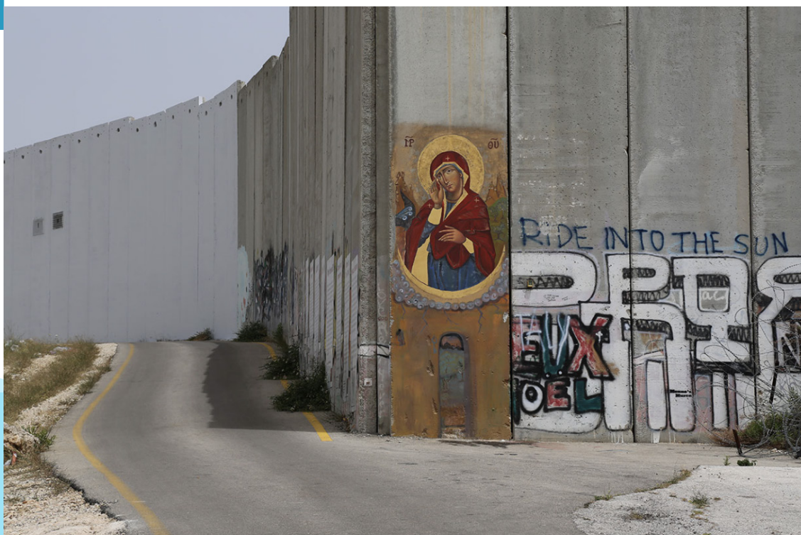
Notre Dame qui fait tomber les murs, à Bethléem

L'inauguration ne sera accessible que sur invitation , mais l'exposition sera ouverte au public dès le samedi 16 septembre après-midi (entrée : 2 €. Gratuit -12 ans, personnes avec un handicap et clergé). Le soir même, à 20h, rendez-vous au char de la place Edon pour une procession aux flambeaux jusqu'à la basilique de Notre-Dame de la Garde, pour clore la neuvaine de prière (lire page 24) et ouvrir officiellement la semaine des Rencontres méditerranéennes.