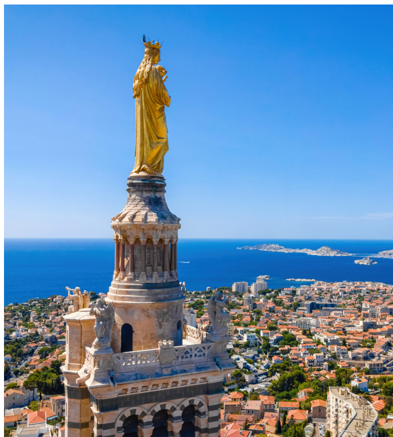
Notre-Dame de la Garde à Marseille

Ces rencontres seront accompagnées d'un festival pour faire goûter cet événement à un public plus large : fidèles des provinces méditerranéennes françaises, habitants de la ville et pèlerins venus de toute la France. Dans ce festival, s'impliqueront